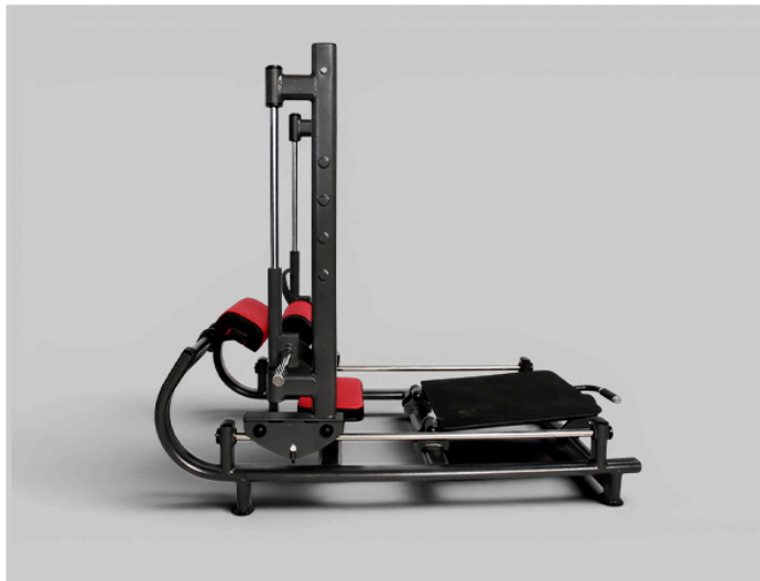
ELEVAÇÃO PÉLVICA GUIADA