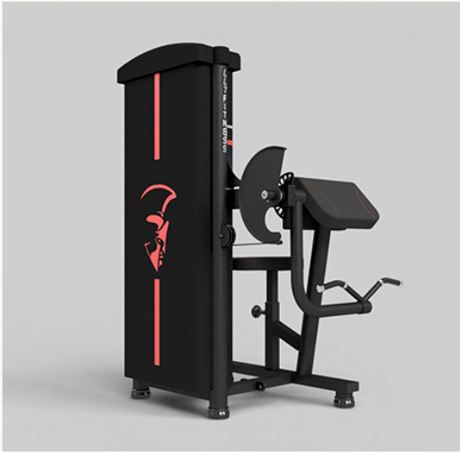
BÍCEPS MÁQUINA PREMIUM