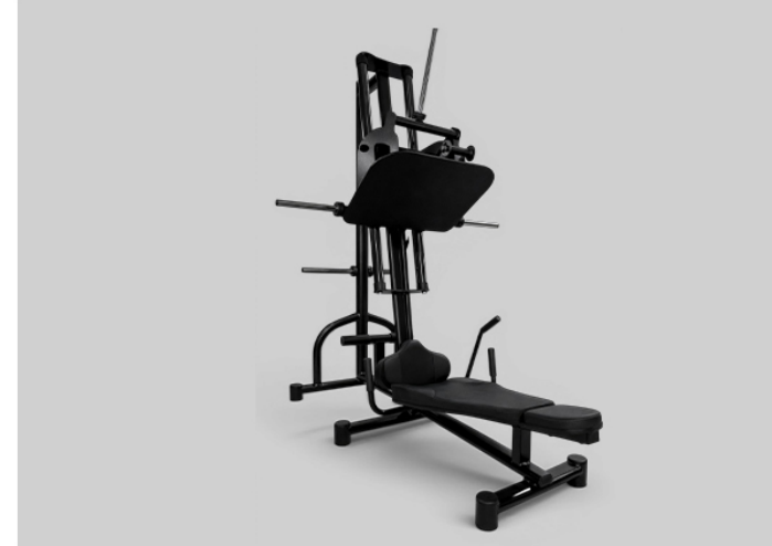
LEG PRESS 90