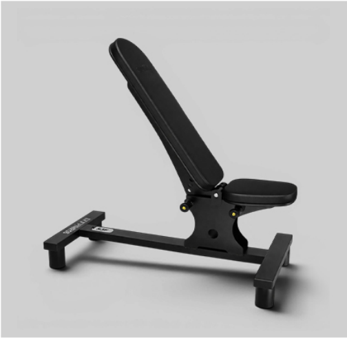
BANCO 2 EM 1